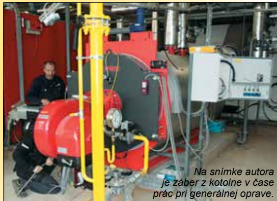
Na snímke autora je záber z kotolne v čase prác pri generálnej oprave.