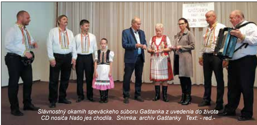
Slávnostný okamih speváckeho súboru Gaštanka z uvedenia do života CD nosiča Našo jes chodila. Text: - red.