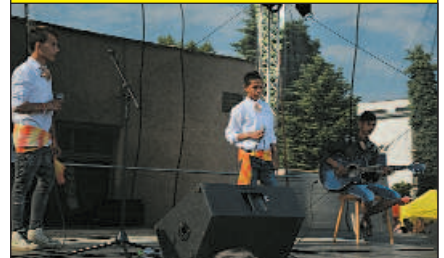
Žiaci špeciálnej triedy základnej školy