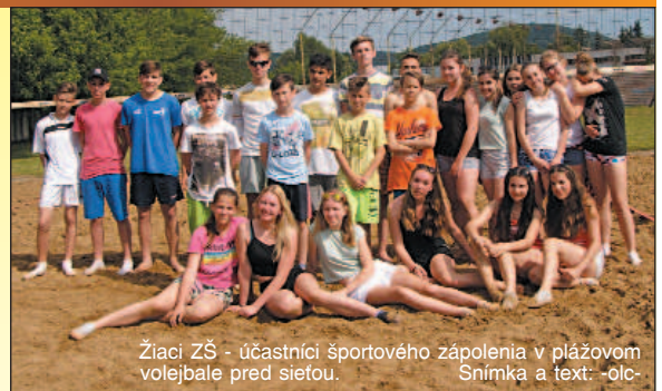
Žiaci ZŠ - účastníci športového zápolenia v plážovom volejbale pred sieťou. Snímka a text: -oll-