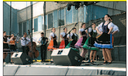
Folklorný súbor Strážčan

V bohatom kultúrnom programe v prvý i druhý jarmočný deň v ľudovom tóne vystúpili a potlesk obecnosti zožali (na snímkach Petra Kičinku):