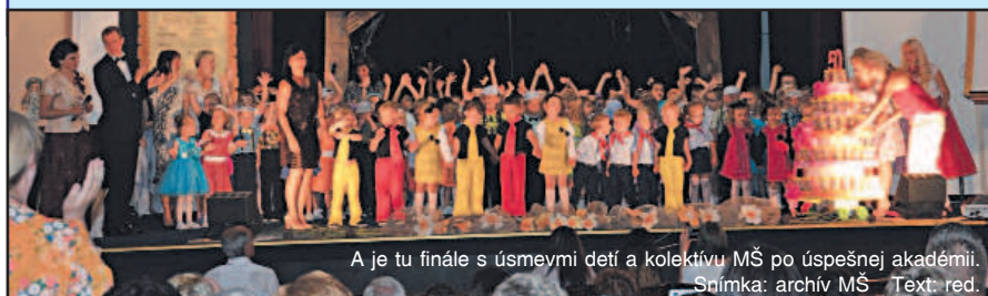
A je tu finále s úsmevmi detí a kolektívu MŠ po úspešnej akademii.