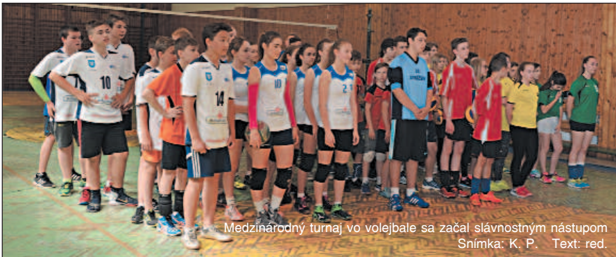
Medzinárodný turnaj vo volejbale sa začal slávnostným nástupom Text: red.