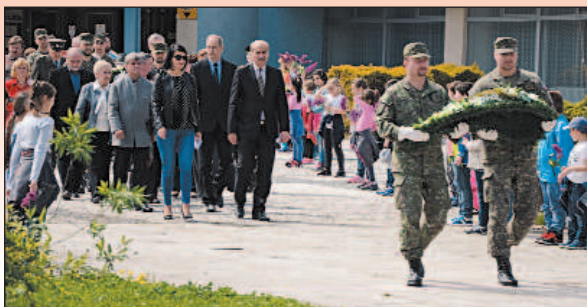
Vojaci z Michaloviec niesli ako prvý veniec v mene mesta Strážske. Špalier k pamätníku vytvorili žiaci ZŠ.