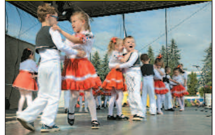
Deti z materskej školy