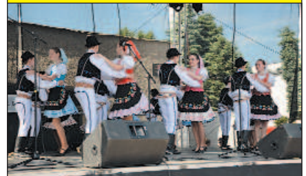
DFS Strážčanik z centra voľného času