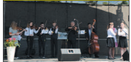
Ľudová hudba základnej umeleckej školy