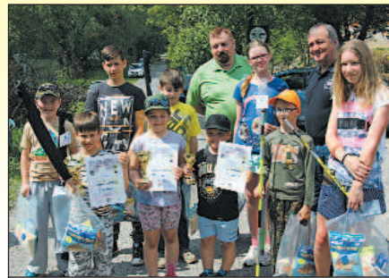
Ocenení pretekári v kategórii deti.

Organizátori sú vďační sponzorom: mestu Strážske, MsO SRZ Michalovce, rybárskym potrebám Peter a H plus H, firme Orim, rodine Ohradzanskej a ďalším nemenovaným sponzorom, ako aj členom SRZ, ktorí nám pomáhali. Ján Sisák