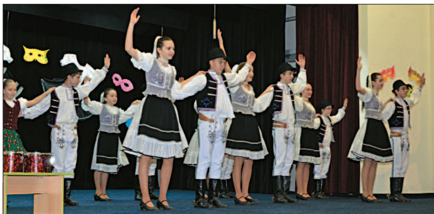
Detský folklórny súbor Stražčanik z CVČ potešil publikum na Fašiangovinách 2016.