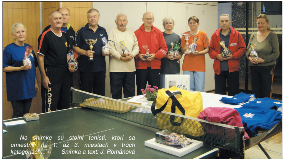
Na snímke sú stolní tenisti, ktorí sa umiestnili na 1. až 3. miestach v troch kategóriách. Snímka a text: J. Románová

"Koniec leta rozhodne neznamená koniec zaujímavých akcií a podujatí, ktoré chceme ľuďom ponúkať...", uviedol primátor mesta vo svojom príhovore. Preto sa už teraz tešíme na ďalšie stretnutie sa vami. -bad-