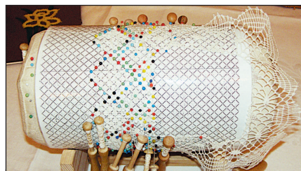
Valček - ako symbol paličkovanej čipky - mal čestné miesto.