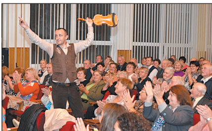
Veselo bolo na mestských oslavách tohoročných jubilantov v rámci podujatia počas Mesiaca úcty k starším. Text: -gg-

Po kultúrnom programe nasledovalo pre všetkých zúčastnených chutné občerstvenie. -bad-