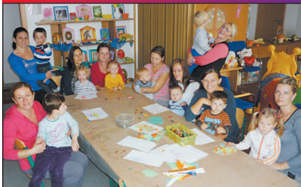
Na snímke z archívu CVČ sú členovia Drobček klubu.

Centrum voľného času Strážske v školskom roku 2014/2015 zriadilo 25 záujmových útvarov. Vyše 270 účastníkov bude svoj voľný čas aktívne využívať v niektorom z tradičných, či novo vytvorených krúžkoch, kluboch, súboroch.