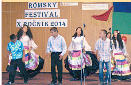
Vystúpenie Strážčanského úsmevu začínala mladšia skupina a tancom prezentovali svoj temperament.