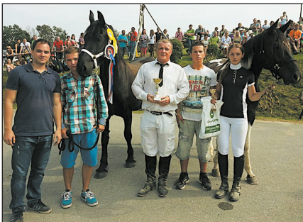
Reprezentanti ranchu zo Strážskeho na výstave koní v Pavlovciach s trofejami. Pekne zapózovali aj koničky.