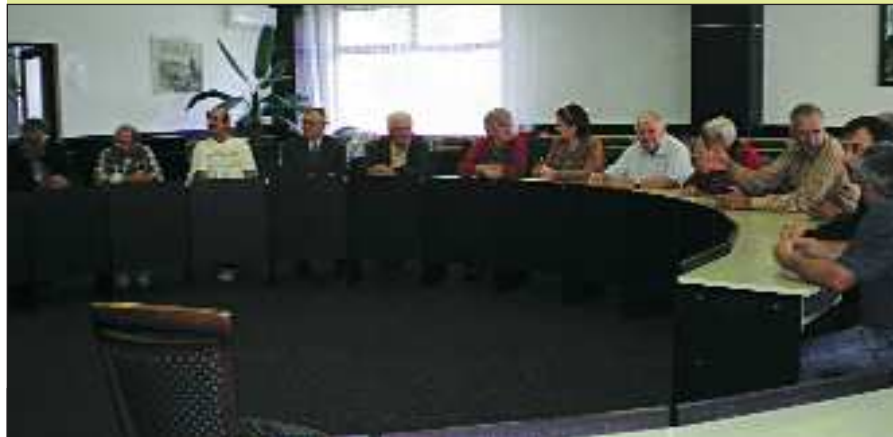
Pohľad na pozvaných účastníkov osláv 50. výročia KST v Strážskom v zasadacej miestnosti MsÚ, kde si prevzali Zlaté odznaky KST, čestné uznanie, ďakovné listy... Text: G. G.

Oslavy 50. výročia založenia Klubu slovenských turistov v Strážskom sa konali 21.9.2012 a boli rozdelené na tri časti.