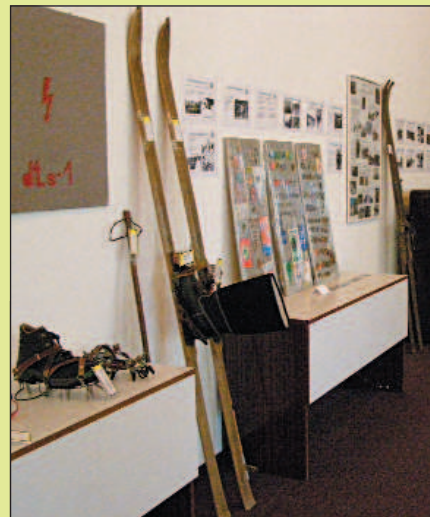
Bohatá bola výstava KST. Okrem fotografických a písomných dokumentov, odznakov boli tam aj staručké lyže, lyžiarky, stan s príslušenstvom, ale aj výbava vysokohorských turistov... Snímka a text: G. Grmolcová

Oslavy sú za nami a hneď po nich vstupujeme do 51. roka svojej činnosti turistov v Slánskych vrchoch spojenou s návštevou opáľových baní na Dubniku. Ján Sabo