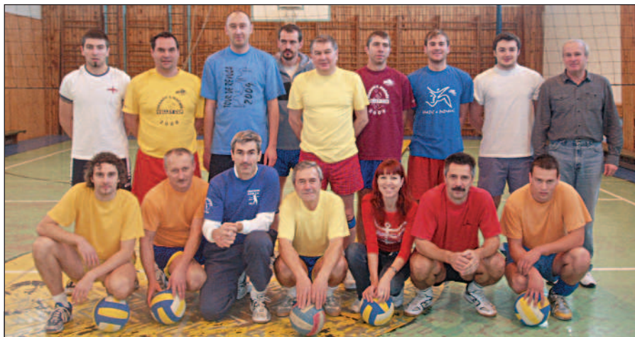
Volejbalový klub Strážske v sezóne roku 2011.