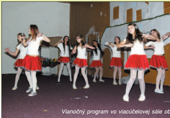
Vianočný program vo viacúčelovej sále obohatili aj tieto dva kolektívy dievčat zo ZŠ.