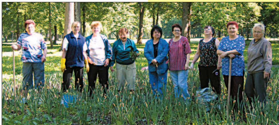
Účastníčky brigády v mestskom parku. Výsledok brigády priniesol účastníčkam radosť a bude z toho asi patronát (k článku Dobrý návrh). Snímka a text. G. Grmolcová