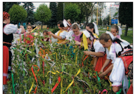
Takto zdobila mládež máj. Podrobnejšie na 2. strane. Snímka a text: G. Gromolcová.

1.6.2011 Medzinárodný deň detí o 14.30 na detskom ihrisku v Strážskom