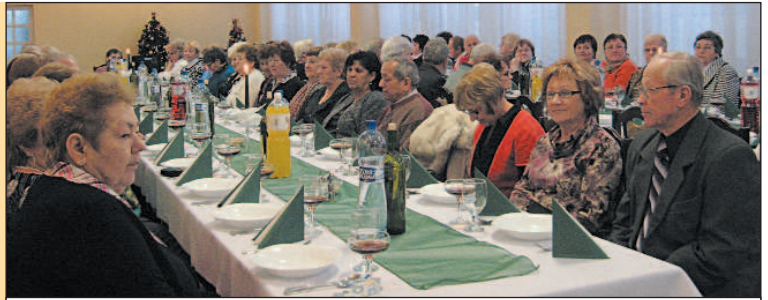
Pohľad na členov klubu dôchodcov pri príhovore primátora mesta.