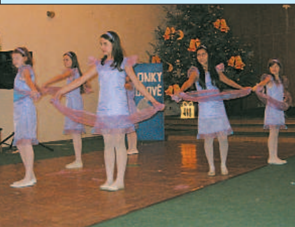
Z vystúpenia žiačok ZŠ v predvianočnom programe. Snímka a text: G. G.

Vianočná akadémia detí sa uskutočnila 13. decembra vo viacúčelovej sále. V programe vystúpili deti z MŠ, žiaci ZŠ, deti z CVČ a DSS Lidwina. Okrem potlesku početného publika si za pekné programové čísla vyslúžili kľúčkových plyšových medvedíkov, ktoré venovala Slovakia Steel Mills, a. s. Strážske. - olc -