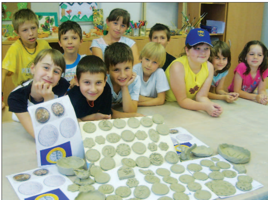
Aj prostredníctvom letnej činnosti CVČ sa deti priblížili novej mene. Na obrázku vymodelované euromince.