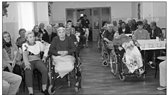
Obyvateľov DDaDSS v októbri svojim programom pozdravilo niekoľko kolektívov. Snímka a text: G. Grmolcovej.