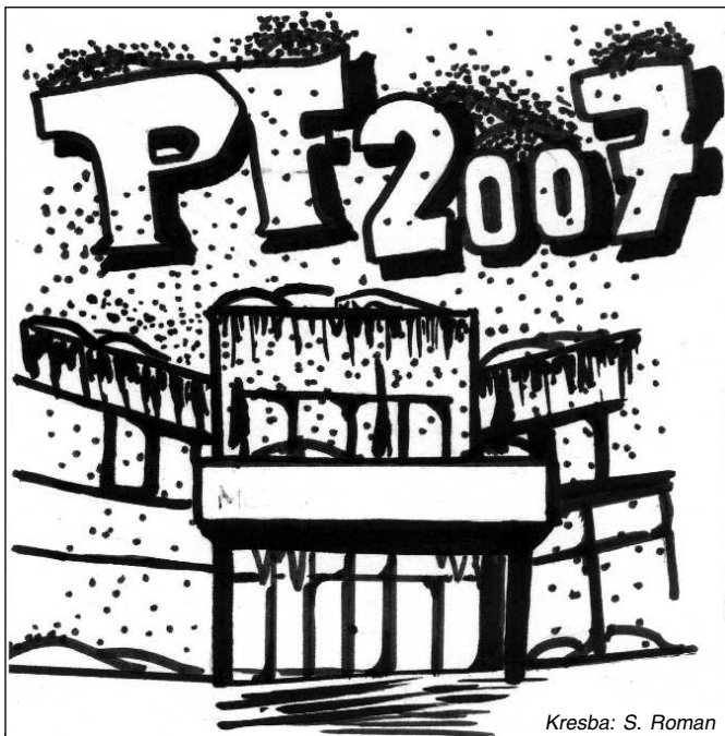
Kresba: S. Roman

„Ďakujeme za doterajšiu spoluprácu a prajeme príjemné prežitie vianočných sviatkov a veľa úspechov v novom roku“ napísali nám zamestnanci a členovia krúžkov CVČ Dúha vo svojom pozdrave. Na spoluprácu sa tešíme aj v tomto roku! - redakcia -