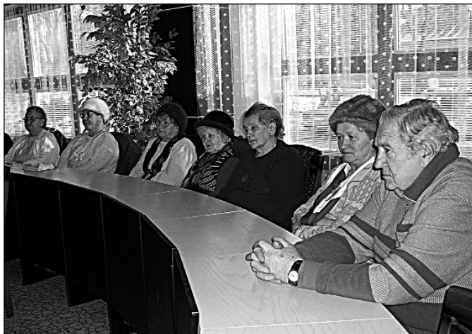
Aktivnu činnosť v meste vyvíjajú členovia klubu dôchodcov. Svoju prácu hodnotili na nedávnej schôdzi.